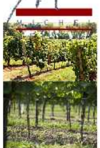
Tablengründe: unten: vordere Mittel